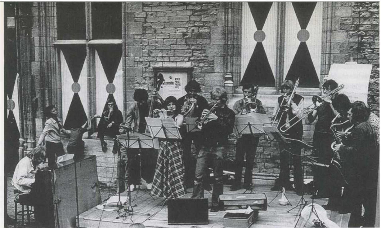
De Volharding in 1973